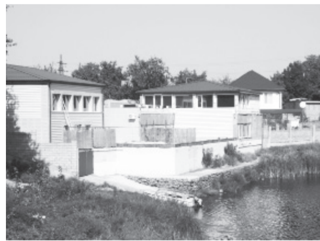
На фото — тот самый садовый домик, который, по декларации Куприя, имеет площадь 60 кв. метров.

Ничуть не смущаясь, он сбрасывает в реку свои неочищенные канализационные стоки, превращая некогда любимое место отдыха сотен дачников и их друзей в вонючую сточную и заболоченную канаву.